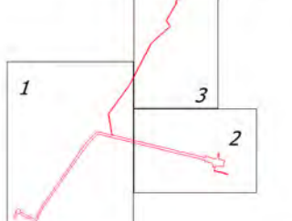
Схема расположения листов